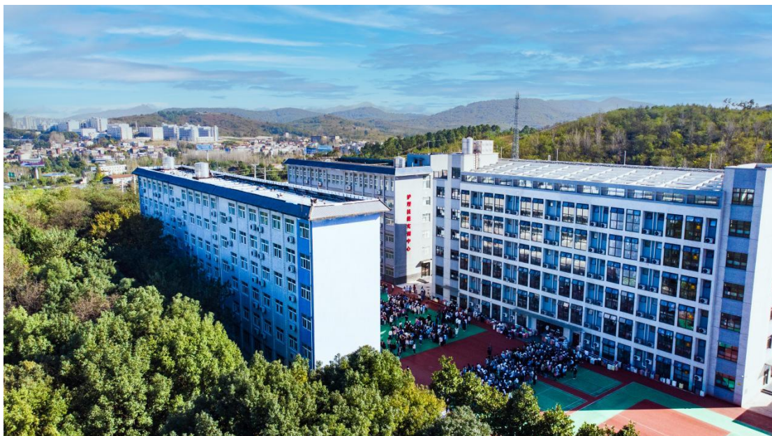
图 2 校园一角

学校在襄阳职业技术学院领导下，以服务襄阳地区护理事业发展为主线，持续深化教育教学改革，加强内涵建设，进一步拓宽服务领域，持续做好湖北省优质护理专业建设任务，不断构建多元化、多渠道、多形式、多层次的办学模式，使学校的办学活力明显增强，办学特色更加鲜明，内部管理更加规范，办学实力和社会服务能力显著提升。