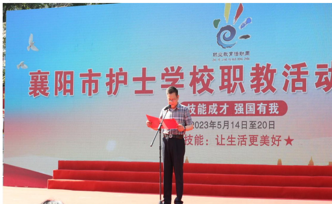
图 7 2023 年职教活动周

2023 年 5 月 18 日，襄阳市护士学校开展了以“技能成才，强国有我”为主题的职教活动周成果展。在职教活动周的当天上午举行了护理礼仪和授帽仪式展示、心肺复苏操作竞赛的决赛和颁奖、幼儿照护和茶艺技能的展演。在职教周的活动舞台上，同学们脸上露出自信的微笑，在规定时间内，有条不紊地操作展示，动作娴熟，声音清亮，操作准确，仪态优美，以最佳的精神状态展现各自的风采。开展职教活动周，不仅提高了学生的操作技能上的动手能力，提高了学生对护理职业的认识，坚定了对从事护理事业的决心，而且培养了全体学生守初心、担使命的社会责任感，达到了“仁心育人”的良好教育目的。