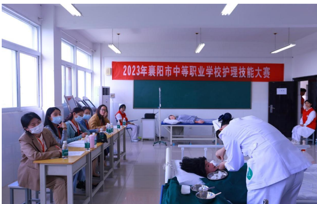
图 3 2023 年襄阳市中职学校护理技能大赛

学校固定资产 5961.476 万元，教学、实习仪器设备总值 677.34 万元，当年新增教学、实习仪器设备总值 118.24 万元。学校配套设施设备完善，拥有网络计算机室、电子阅览室等，专业实训中心功能齐全，设施仪器先进，2023 年 8 月，学校对实训中心进行改造升级，便于实施“岗、课、赛、证”理实一体化教学，为承接省、市级各类大赛做准备。