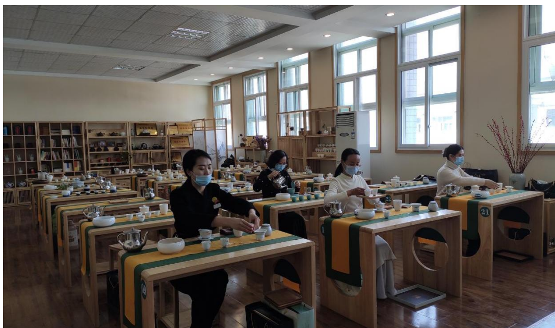
图 14 茶艺学习

襄阳市护士学校一直以来从事茶艺师培训，近几年来培养了许多优秀的茶艺学员，并多次在省、市级茶艺大赛中获奖；学校社团成立茶艺社，吸纳茶艺爱好者，开展茶艺交流学习。通过茶文化学习培训陶冶情操，修身养性，增强了信心，开阔了眼界，激发了对中华优秀传统文化的热爱。