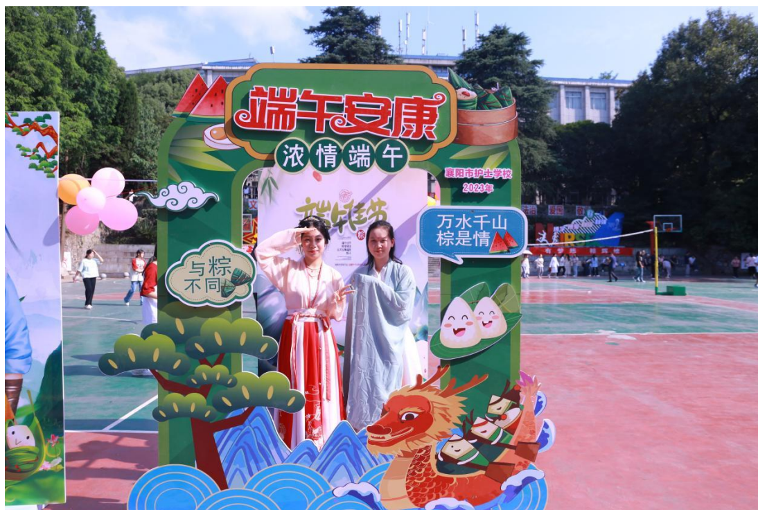
图 13 端午节学生活动

2022 年以来，深挖校史，传承儒家传统仁文化，结合医药卫生专业特色，提炼出校园“仁”文化建设方案，践行“仁心”育人目标，学生在校仁育三年，涵养一生，形成“仁心育人，育仁心人”的特色与亮点，构建我校三全育人“三好二有”的新格局，品德好、身心好、技能好、有志趣特长、有创新能力，兼具仁心、仁身、仁术、仁智、仁才。中华优秀传统文化的传承与弘扬，是立德树人、学校教育实效性的重要保障，也为校园文化提供了丰富的内容和发展动力。推进中华优秀传统文化融入校园文化建设，形成校园文化与传统文化的交响与共鸣。