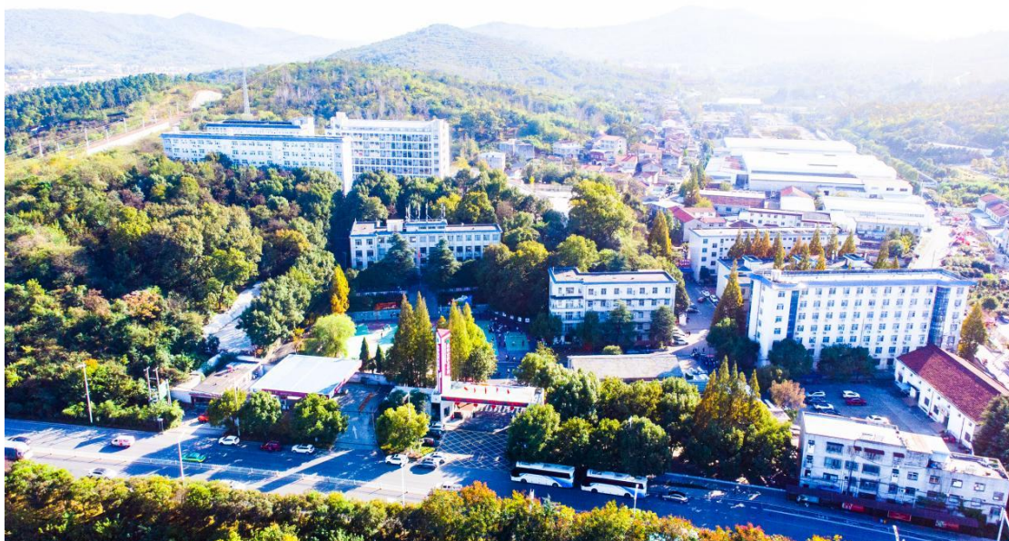
图 1 学校全景

襄阳市护士学校创办于 1979 年，2019 年划归襄阳职业技术学院统一管理，是襄阳市唯一一所培养护理人才为主的普通中等职业学校，是教育部授予的国家级重点中等专业学校，省教育厅授予的省级示范性中等专业学校和省级优质专业学校。襄阳市护士学校坐落于襄阳市襄城区隆中大道，毗邻古隆中。学校规划面积 14 万平方米，现学校建筑面积 8.5 万平方米，教学及辅助用房面积 1.5 万平方米，行政办公和生活用房 1.7 万平方米。2023 年学校开设有护理、药剂、中医康复技术、卫生信息管理、医学检验技术、医学影像技术 6 个专业，其中中医康复技术、卫生信息管理、医学检验技术专业方向为“3+2”高职连读模式。