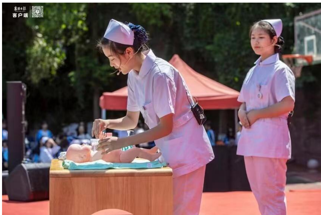
图8 幼儿照护技能展示