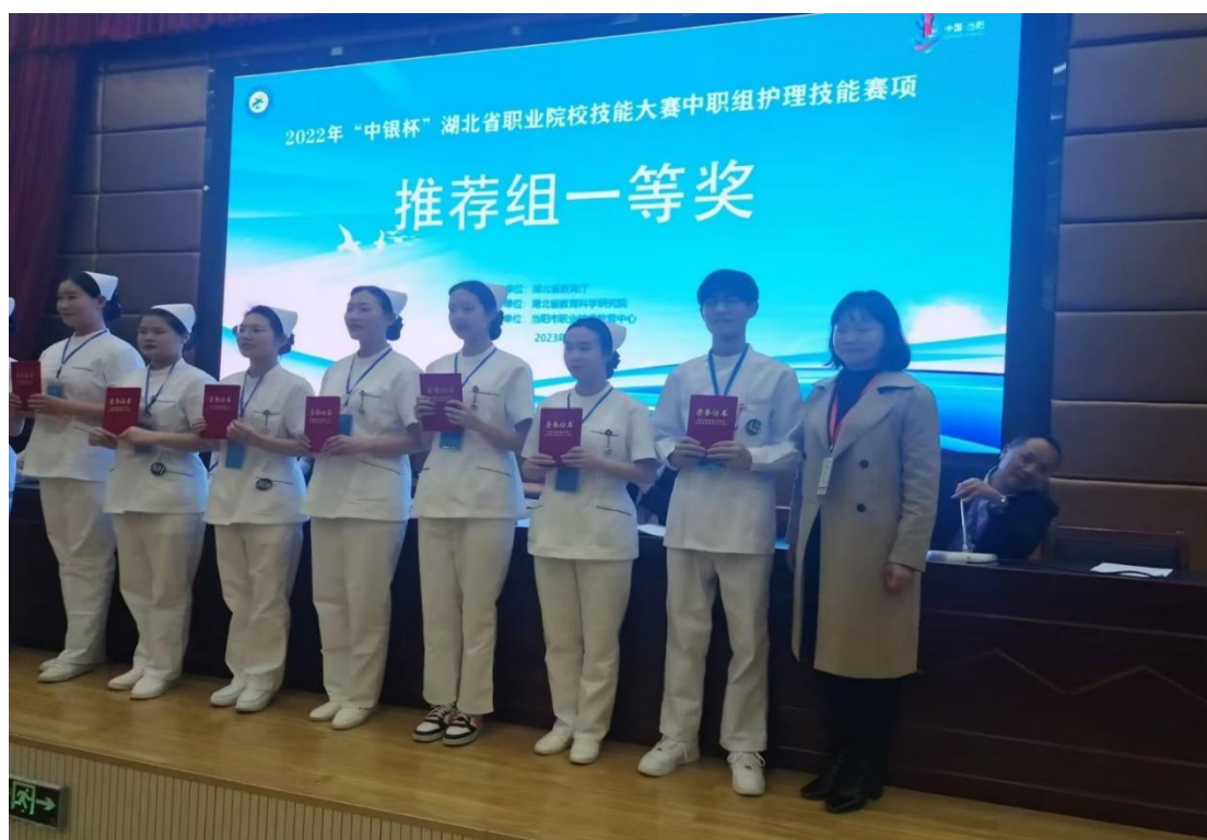
图 12 2023 年湖北省职业院校护理技能大赛获一等奖

建设与教学方法的改革、校企深度合作的实习实训、双师型教师团队的建设、教学资源的共享等系统性工作；学校结合国家和市级技能大赛标准及内容，将其转化为具体教学项目，并融入专业课程教学中，从而对课程教学进行完善和补充，加速职业技能竞赛内容的普及，达到以大赛促进教学改革和教学质量的提高。