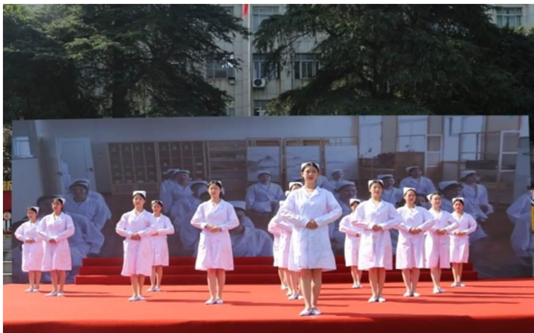
图 10 护理礼仪展示