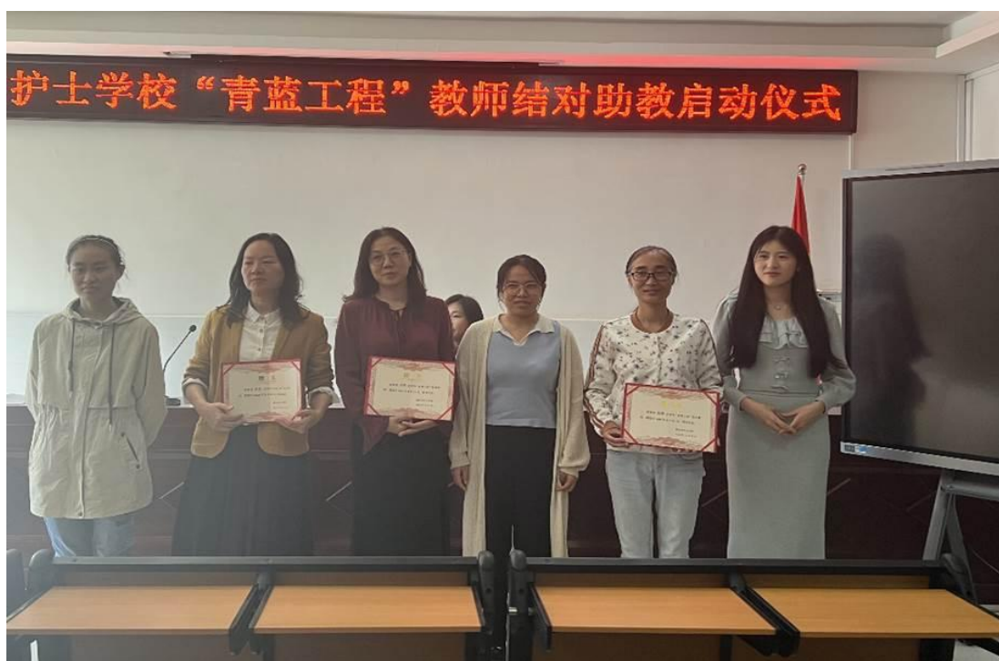
图 15 青蓝工程拜师结对

学校每年都会定期举行“青蓝工程”的结对拜师活动，借此机会向各位新老教师提出了结对助教的各项工作要求，对新进教师今后的发展提出了明确的要求和期望，做到期初有落实、期中有检查、期末有验收与总结，力争通过“青蓝工程”活动，使新进教师半年入门、一年过关、三年成骨干，进一步促进学校教育教学高质量发展。